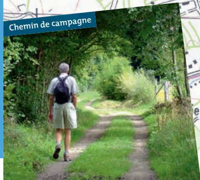
Chemin de campagne